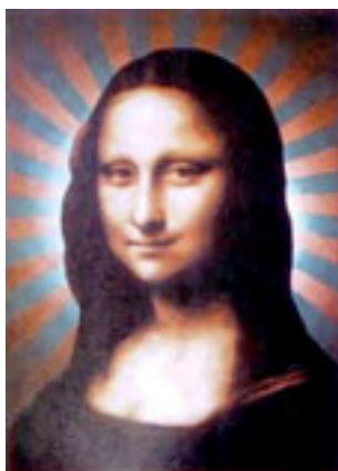
Sparkling Paris, 2008.