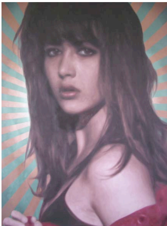
Sparkling Paris 2008

2007 Participe à la Documenta XII Kassel